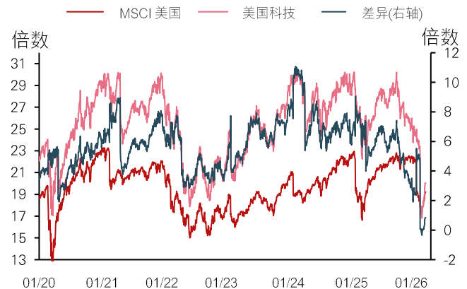
图 2：目前信息技术板块的市盈率溢价处于五年多以来的低位

过往表现并非未来表现的可靠预测。MSCI：明晟