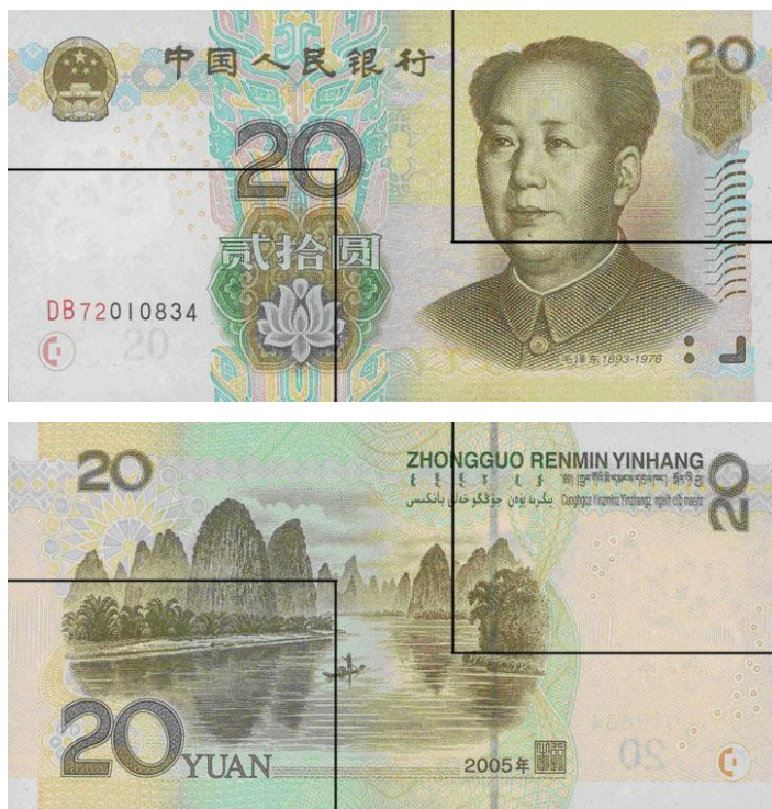
图B.3 贰拾圆检测采样点