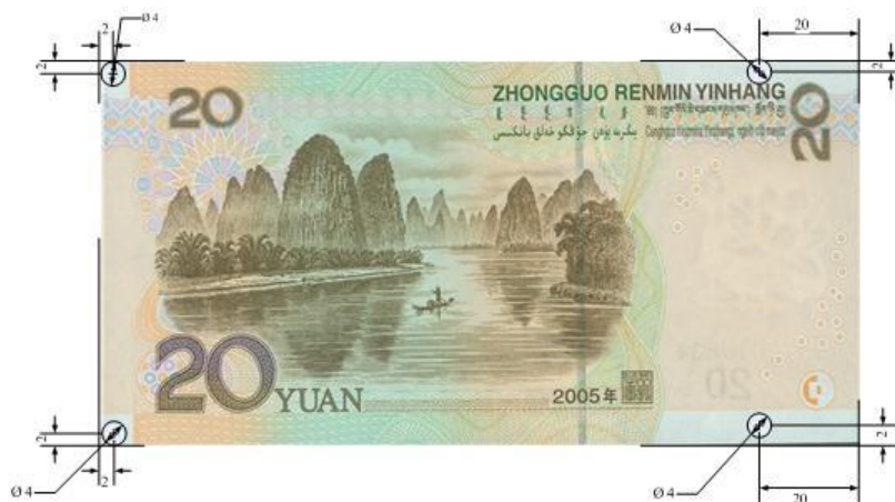
图 A.3 (续)