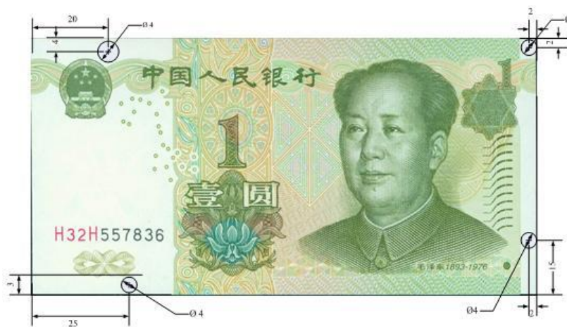
图A.6 壹圆检测采样点 (单位: mm)