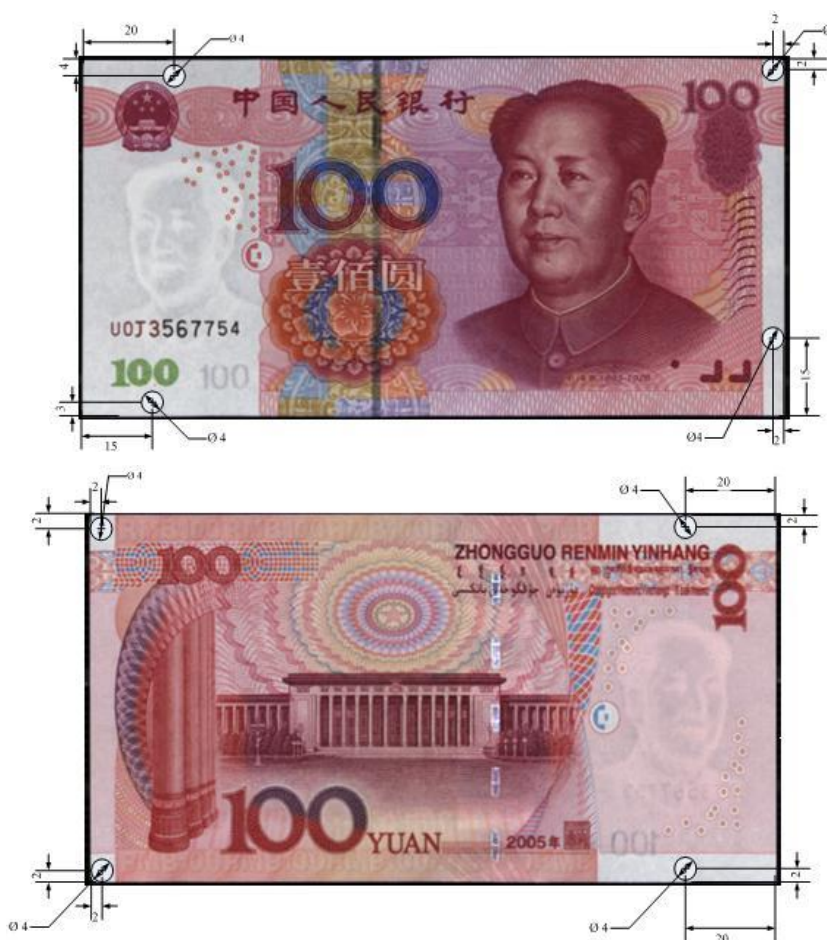
图A.1 壹佰圆检测采样点 (单位: mm)

分别在正面和背面各选取4个非印刷区采样点，如图A.1、A.2、A.3、A.4、A.5、A.6所示。