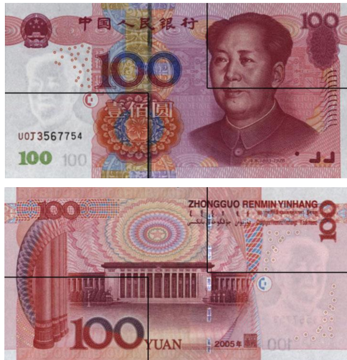
图B.1 壹佰圆检测采样点