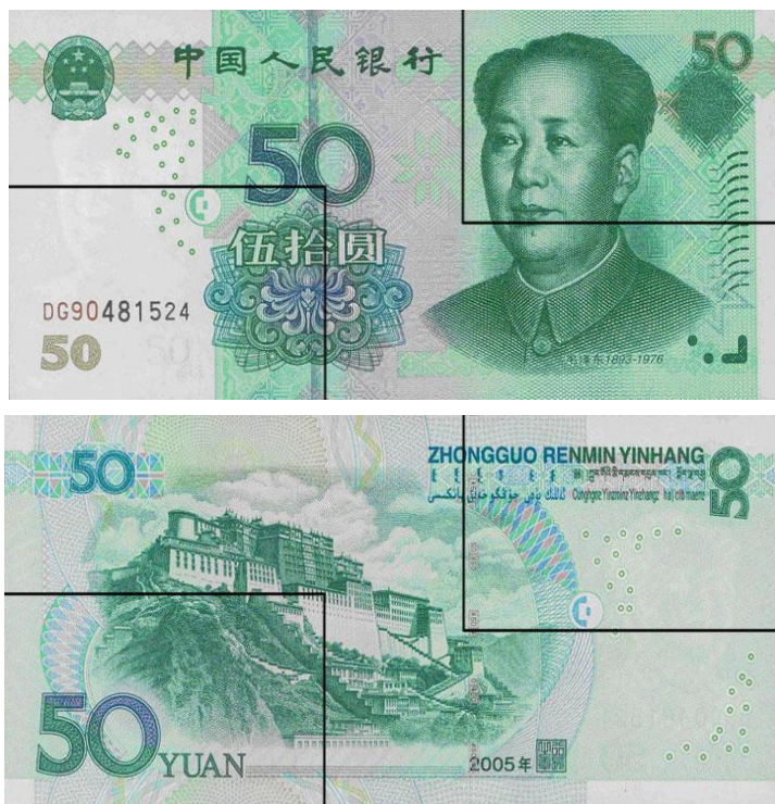
图B.2 伍拾圆检测采样点