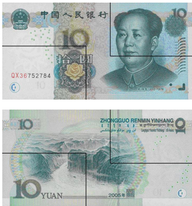
图B.4 拾圆检测采样点