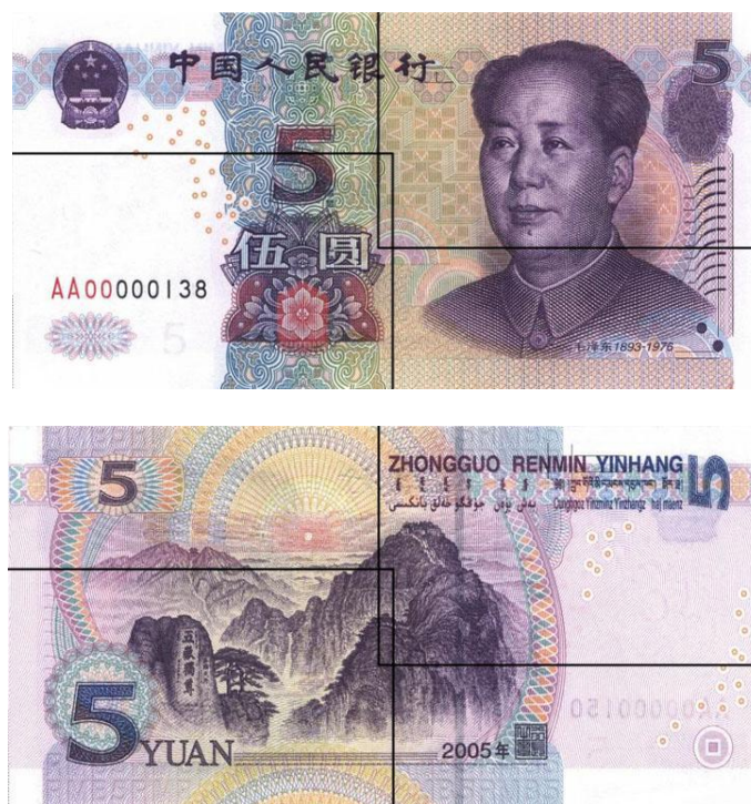
图B.5 伍圆检测采样点