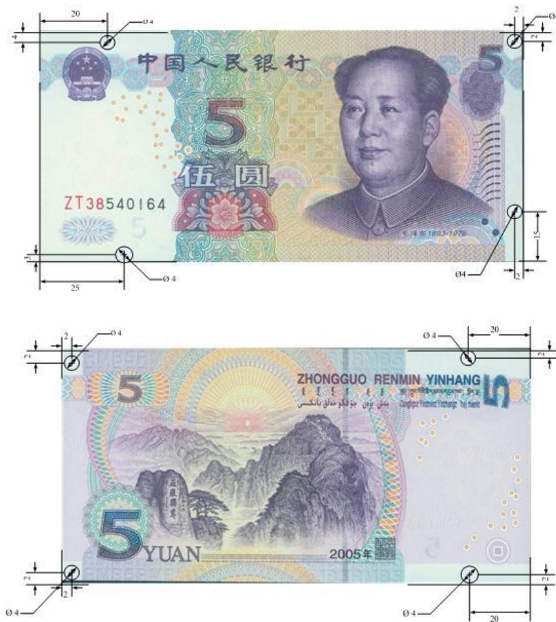
图A.5 伍圆检测采样点 (单位: mm)