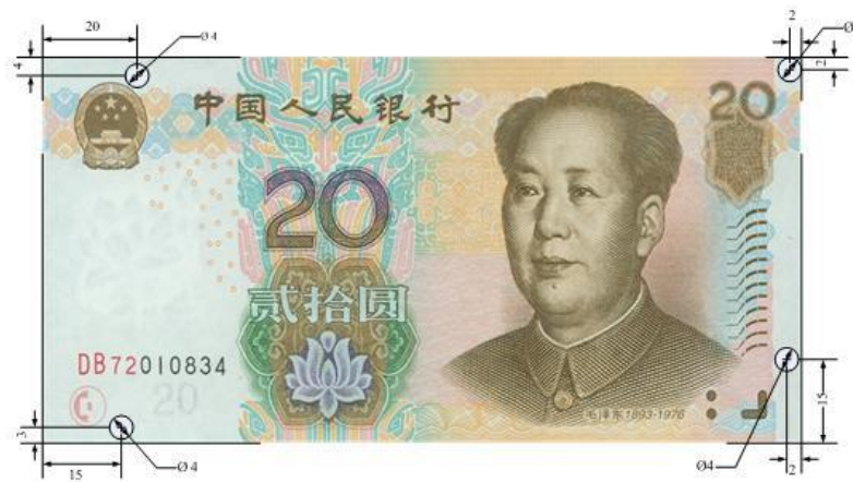
图A.3 贰拾圆检测采样点 (单位: mm)