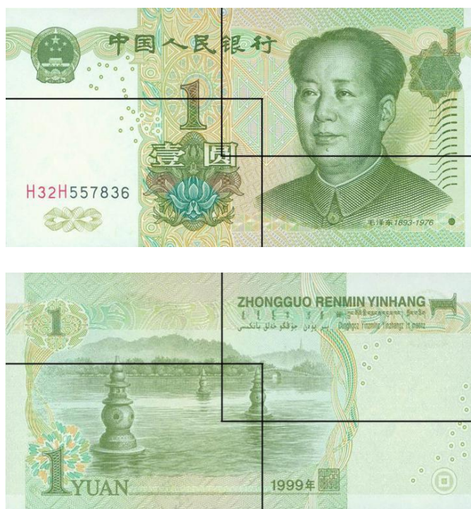
图B.6 壹圆检测采样点