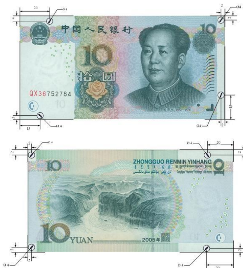
图A.4 拾圆检测采样点 (单位: mm)