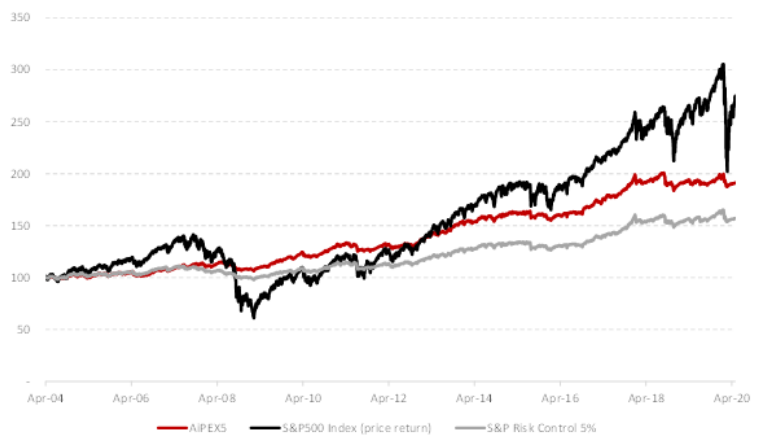
AiPEX5 vs. 标普 500 指数历史表现

汇丰银行 (HSBC) 是全球规模 最大的银行及金融机构之一， 拥有本指数的独家授权。